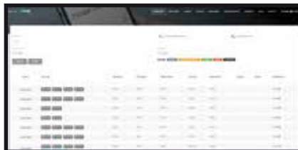
Resumen de fichajes totales