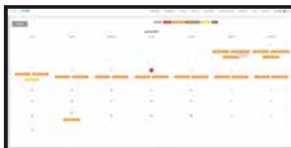
Resumen de permisos y vacaciones