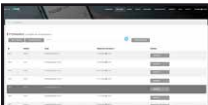
Vista de todos los empleados