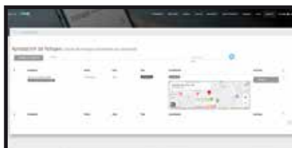
Pantalla de aprobación de fichajes