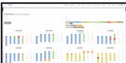
Vista intuitiva de calendario